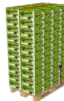
Palette de • 8 plateaux par couche • 10 couches • Palette 800 x 1200 Poids : 712 kg