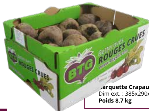
Marquette Crapaudine BTG Dim ext. : 385x290x180 mm Poids 8.7 kg

Utilisation prévue : Produit 1 ère gamme à éplucher, généralement utilisé assaisonné