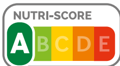
Table de composition nutritionnelle Ciqual 2013