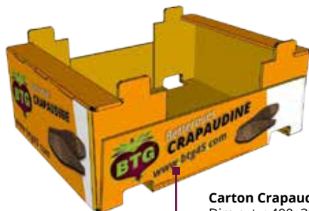
Carton Crapaudine BTG Dim ext. : 400x300x140 mm Poids 5.4 kg

Le sel est exclusivement dû à la présence de sodium présent naturellement