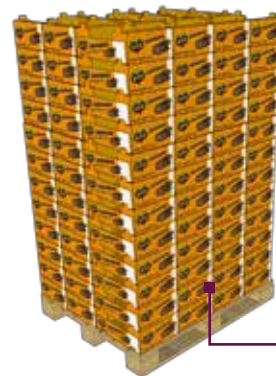
Palette de • 10 plateaux par couche • 12 couches • Palette 1000 x 1200 Poids : 648 kg