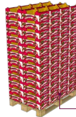
Palette de • 8 plateaux par couche • 12 couches • Palette 800 x 1200 Poids : 545 kg