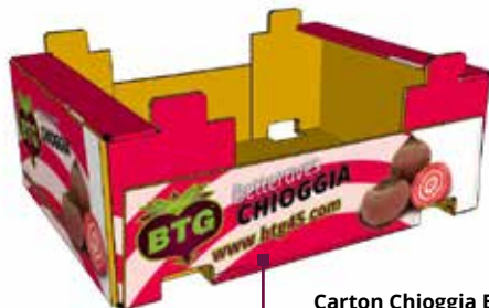
Carton Chioggia BTG Dim ext. : 400x300x140 mm Poids 5.4 kg

Le sel est exclusivement dû à la présence de sodium présent naturellement