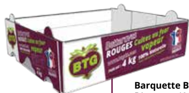
Barquette BTG Dim ext. : 400x300x94 mm Poids 4.3 kg

Utilisation prévue : Produit 1ère gamme à éplucher, généralement utilisé assaisonné