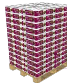
Palette de • 8 plateaux par couche • 12 couches • Palette 800 x 1200 Poids : 440 kg