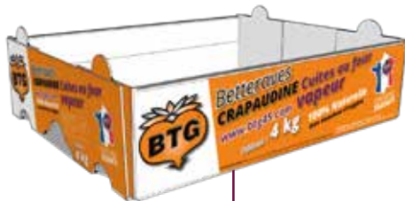
Barquette Crapaudine BTG Dim ext. : 400x300x94 mm Poids 4.3 kg

« Le sel est exclusivement dû à la présence de chlorure de sodium présent naturellement »